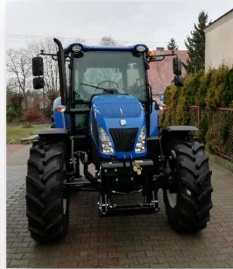
Ciągnik rolniczy New Holland TD5.105