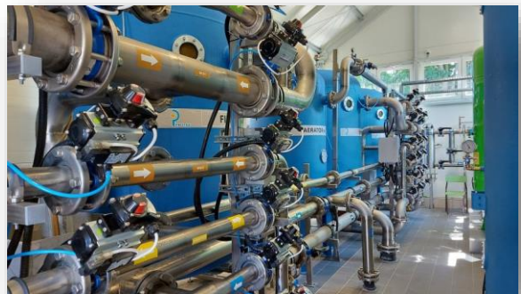
Zmodernizowana stacja uzdatniania wody w Magnuszewie

W 2021 – 2023 przeprowadzono gruntowną modernizację stacji uzdatniania wody w Magnuszewie. Zadanie w całości sfinansowane zostało ze środków budżetu Województwa Mazowieckiego w kwocie ponad 1,4 mln zł .