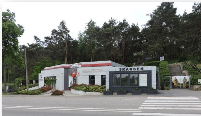
Nowy pawilon w Skansenie w Mniszewie

Dla uatrakcyjnienia pobytu osób zwiedzających Skansen, a zwłaszcza dzieci, wybudowano sprawnościowy plac zabaw, którego wartość wyniosła prawie 50 tys. zł .