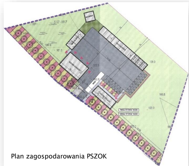
Plan zagospodarowania PSZOK

Na teren nowego obiektu dostarczane będą odpady zebrane z obszaru gminy, a następnie dosegregowywane i przekazywane do ponownego użycia, recyklingu i odzysku odpowiednimi metodami. Realizacja inwestycji winna wpłynąć na zmniejszenie ilości odpadów składowanych oraz na poprawę warunków ekologicznych i ekonomicznych gminy.