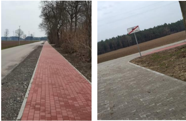
Droga w m. Trzebień do osiedla PGR