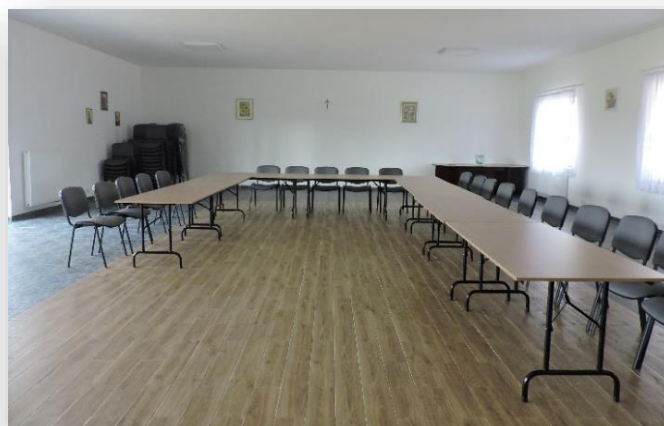
Wyposażenie świetlicy wiejskiej w Dębowoli