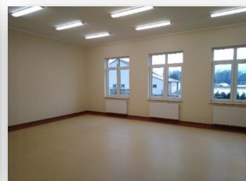
Nowo dobudowane skrzydło w Szkole Podstawowej w Rozniszewie