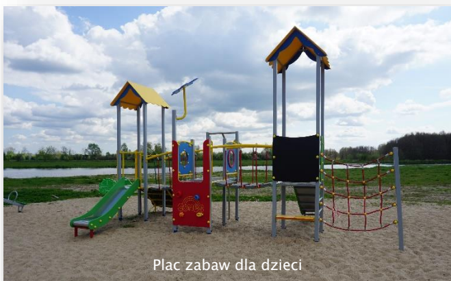
Plac zabaw dla dzieci

W sąsiedztwie boiska urządzono duży plac zabaw dla dzieci.