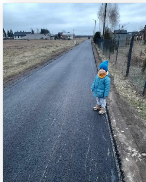
Zmodernizowana droga w Rozniszewie