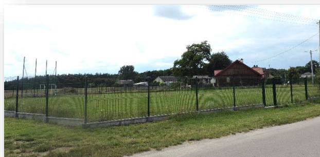
Boisko sportowe przy świetlicy wiejskiej w Trzebieniu

W roku 2019 w ramach „Mazowieckiego Instrumentu Aktywizacji Sołectw MAZOWSZE 2019” zrealizowano projekt pn. „Zagospodarowanie terenu przy świetlicy wiejskiej w Trzebieniu” Wartość inwestycji wyniosła prawie 23 tys. zł , dofinansowanie – 10 tys. zł . W ramach inwestycji przygotowano teren z przeznaczeniem na boisko sportowe, wykonano ogrodzenie terenu i zamontowano piłkochwyty. Miejsce to cieszy użytkowników, a zwłaszcza dzieci i młodzież.