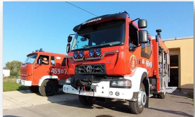
Samochód strażacki w OSP w Chmielewie

W ramach MIAS MAZOWSZE 2020 jednostka OSP w Anielinie otrzymała środki w wysokości 10 tys. zł na wyposażenie budynku strażnicy oraz budowę altany. Gmina przekazała również dotację dla jednostki OSP w Chmielewie na zakup samochodu strażackiego w kwocie 200 tys. zł , z których 100 tys. zł to środki z Województwa Mazowieckiego. Współfinansowano również montaż paneli fotowoltaicznych na budynkach: