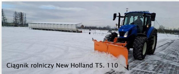
Ciągnik rolniczy New Holland T5.110

W 2023 r. zakupiono ciągnik New Holland T5.110, przyczepę o ładowności 5 ton, pług śnieżny i posypywarkę o ładowności 1 tony. Wartość zakupionego sprzętu przekroczyła kwotę 390 tys. zł .