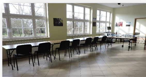
Wyposażenie świetlicy w Przewozie Tarnowskim

Miejsce to stanowi siedzibę działalności Koła Gospodyń Wiejskich.