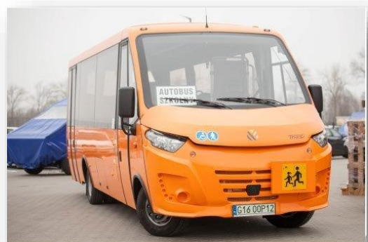
Planowany model autobusu szkolnego

Po pozytywnym rozpatrzeniu wniosku w ramach programu Autobusy dla mazowieckich szkół, gmina otrzymała dofinansowanie w wysokości 500 tys. zł z przeznaczeniem na zakup autobusu z co najmniej 30 miejscami o wartości 880 tys. zł .