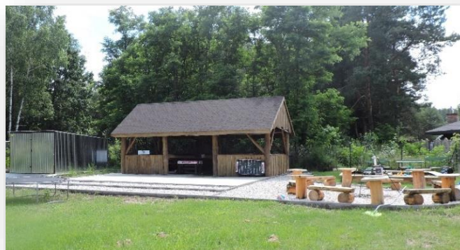
Altana w Basinowie

W ramach „Mazowieckiego Instrumentu Aktywizacji Sołectw MAZOWSZE 2019” zrealizowano projekt „pn. „Budowa altany – wiaty rekreacyjnej w przestrzeni publicznej sołectwa Basinów”. Wartość inwestycji przekroczyła 20 tys. zł , a dofinansowanie – 10 tys. zł . Sołectwo Basinów wsparło tę inwestycję przeznaczając swoje środki na zagospodarowanie placu wokół altany (ponad 12 tys. zł ).