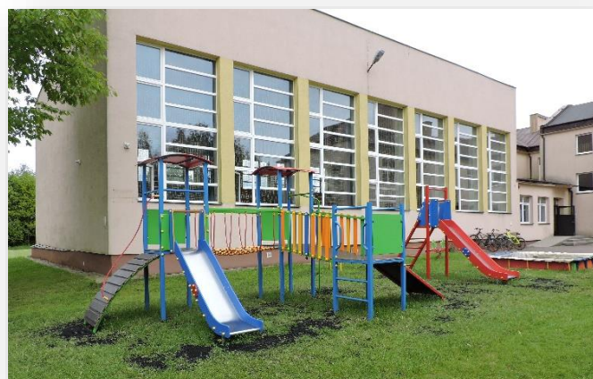
Plac zabaw przy Szkole Podstawowej w Rozniszewie

W ramach „Mazowieckiego Instrumentu Aktywizacji Sołectw” w poszczególnych latach powstawały place zabaw. Przy Szkole Podstawowej w Mniszewie urządzono plac zabaw, którego wartość wyniosła ponad 30 tys. zł , a dofinansowanie w wysokości 10 tys. zł . W miejscowości Osiemborów przy świetlicy wiejskiej powstał plac zabaw, o wartości prawie 20 tys. zł , dofinansowanie 10 tys. zł . Przy Szkole Podstawowej w Rozniszewie powstał plac zabaw sfinansowany z środków Funduszu Sołectw: Anielin, Boguszków, Rozniszew, Kolonia Rozniszew. Wartość inwestycji przekroczyła kwotę 38 tys. zł .