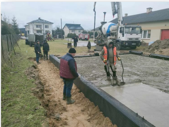
Budowa garażu dla OSP w Wilczkowicach Dolnych

Wartość przedsięwzięcia wynosi 195 tys. zł . Zadanie sfinansowane zostanie w całości z budżetu własnego gminy. Planowany termin ukończenia robót budowlanych tj. stan surowy zamknięty – II kwartał 2024 r.