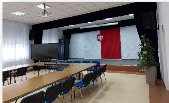
Sala konferencyjna w Urzędzie Miasta i Gminy w Magnuszewie

W 2023 r. w ramach programu Mazowsze dla Lokalnych Centrów Integracyjnych przeprowadzona została modernizacja sali konferencyjnej w Urzędzie Gminy w Magnuszewie. W ramach zadania wymienione zostały okna z roletami oraz zamontowane zostało nowe nagłośnienie, laserowy projektor z automatycznym ekranem oraz monitor interaktywny, a także kurtyna sceniczna. Ogólny koszt zadania wyniósł 152 tys. zł , a dofinansowanie 122 tys. zł . Po modernizacji sala pełni wielorakie funkcje m.in.: organizacji posiedzeń, koncertów, seansów filmowych i przedstawień teatralnych.