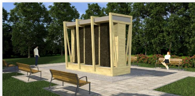
Wizualizacja tężni solankowej w Magnuszewie

W miejscowości Magnuszew, na terenie obiektu rekreacyjno-wypoczynkowego, rozpoczęto realizację zadania polegającego na budowie tężni solankowej. Inwestycja powstaje w ramach zadania „Mazowsze dla klimatu 2023”. Całkowity jej koszt to prawie 310 tys. zł , a przyznana pomoc wynosi 200 tys. zł . Realizacja inwestycji ma między innymi walor profilaktyki zdrowotnej.