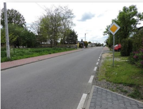
Zmodernizowana ul. Partyzantów w Magnuszewie

Ponadto w latach 2018–2023 wykonywane były roboty drogowe polegające na uzupełnieniu ubytków w nawierzchni kruszywem i szlaką w łącznej ilości 17 800 ton, o wartości ponad 1 mln zł .