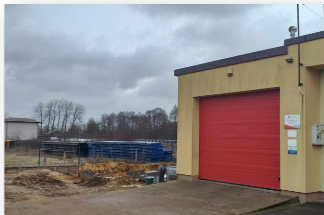
Budowa garażu dla OSP w Chmielewie

Garaże, które zostaną wybudowane przy strażnicach OSP w Chmielewie i w Wilczkowicach Dolnych służyć będą do bezpośredniego utrzymania gotowości bojowej jednostek.