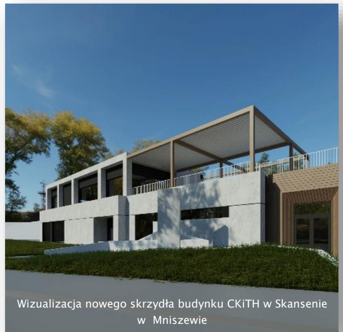
Wizualizacja nowego skrzydła budynku CKiTH w Skansenie w Mniszewie

Wartość zadania wynosi ponad 4,8 mln zł , a udział środków budżetu gminy wyniesie 10% kosztów inwestycji. Zgodnie z otrzymaną promesą inwestycyjną zakończenie realizacji zadania nastąpi w roku 2025.