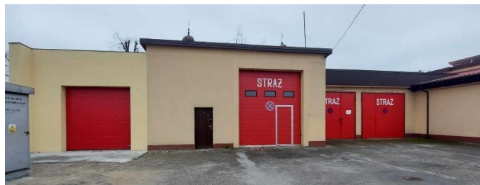
Nowo dobudowany garaż przy OSP w Magnuszewie

W 2022 r. przeprowadzono modernizację budynków ośrodka zdrowia w Magnuszewie oraz ośrodka zdrowia w Mniszewie. Zadanie o wartości 157 tys. zł .