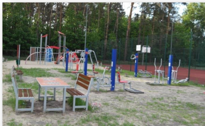
Siłownia plenerowa w Magnuszewie

Na placach przyszkolnych w miejscowościach Mniszew, Rozniszew, Chmielew, Magnuszew oraz Przydworzyce zamontowane zostały urządzenia ruchowe do ćwiczeń na świeżym powietrzu służące dorosłym oraz w części pełniące funkcję placu zabaw dla dzieci. Całkowity koszt zadania wyniósł – ponad 300 tys. zł , w tym dofinansowanie ze środków Funduszu Rozwoju Kultury Fizycznej w ramach programu Rozwoju Małej Infrastruktury Sportowo-Rekreacyjnej o charakterze wielopokoleniowym – Otwarte Strefy Aktywności (OSA) Edycja 2018 wyniosło 150 tys. zł .