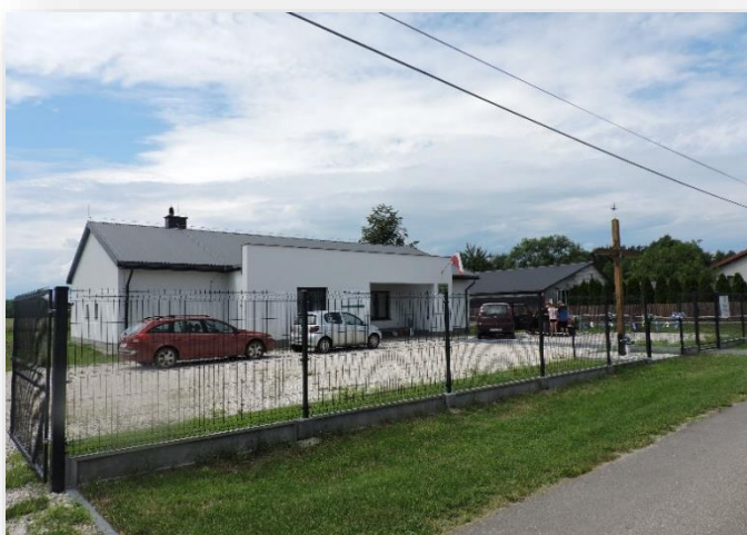
Świetlica wiejska w Dębowoli

Wartość całkowita inwestycji wyniosła prawie 400 tys. zł , w tym dofinansowanie ze środków unijnych przekroczyło kwotę 240 tys. zł .