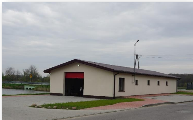
Zmodernizowany budynek przy jeziorze w Magnuszewie

Realizacja inwestycji była etapowana i finansowana z różnych źródeł m.in. z budżetu Województwa Mazowieckiego w ramach „Mazowieckiego Instrumentu Wsparcia Infrastruktury Sportowej”, ze środków Unii Europejskiej w ramach PROW oraz środków własnych Gminy. Wartość inwestycji przekroczyła kwotę 1,3 mln zł , a dofinansowanie wyniosło ponad 700 ty. zł .