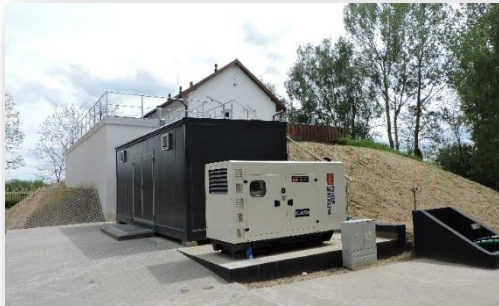
Wyposażenie oczyszczalni ścieków w Magnuszewie w agregat prądowłczy

W ramach realizacji tego zadania wybudowany został nowy zbiornik buforowy oraz komora stabilizacji osadów. Wybudowano sieć kanalizacyjną o długości 3 682 m.b. z dwiema przepompowniami sieciowymi oraz 54 studzienkami kanalizacyjnymi. Na zadanie wydatkowano ponad 3,6 mln zł , w tym ze środków