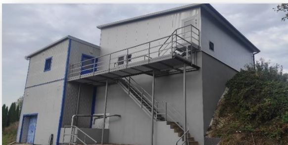
Zmodernizowana oczyszczalnia ścieków w Mniszewie

budżetu Województwa Mazowieckiego – 830 tys. zł i z pożyczki WFOŚiGW – ponad 2,4 mln zł .