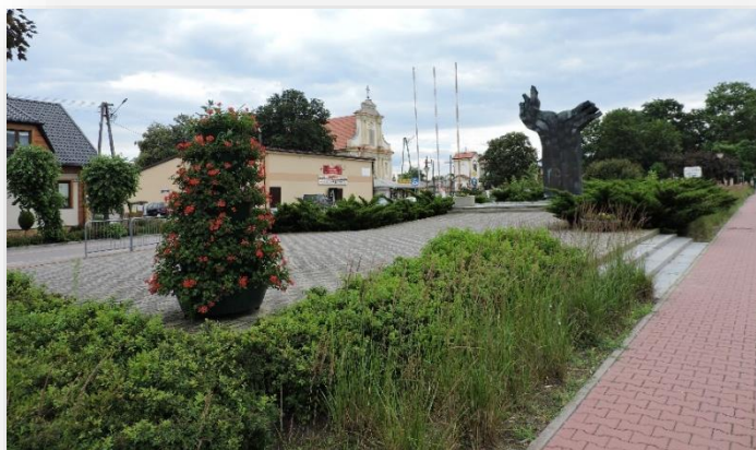
Plac w centrum Magnuszewa

W roku 2019 w ramach „Mazowieckiego Instrumentu Aktywizacji Sołectw MAZOWSZE 2019” zrealizowano projekt pn. „Urządzenie zieleni w przestrzeni publicznej w centrum miejscowości Magnuszew”. Wartość inwestycji wyniosła 25 tys. zł , a dofinansowanie – 10 tys. zł . W ramach projektu zakupiono m.in. kwietniki kaskadowe oraz ławki.