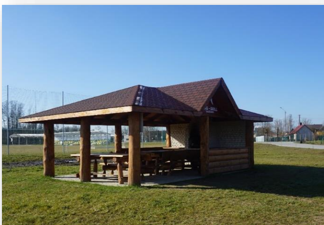
Altana w Magnuszewie

Dodatkowo w ramach realizacji projektu przez Stowarzyszenie LGD „Puszcza Kozienicka” przy placu zabaw posadowiona została zadaszona altana o pow. 35 m 2 z kamiennym grillem i wyposażeniem w stoły i ławy.